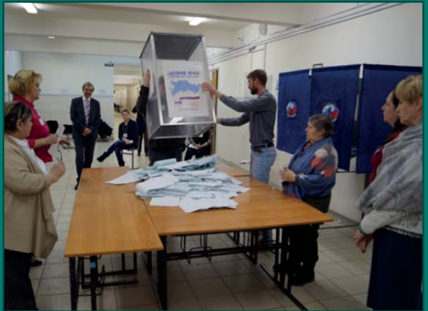
Подведение итогов голосования. УИК № 534 (Калининский район). 18.03.2018.