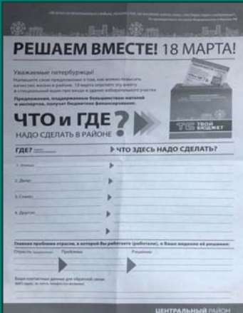
Анкета проекта «Твой бюджет», которая распространялась рядом с избирательными участками.