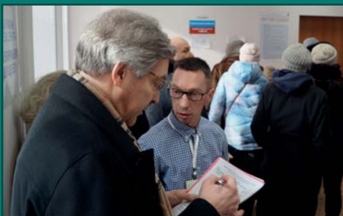
УИК № 185 в месте временного пребывания избирателей. Городская наркологическая больница. 18.03.2018.