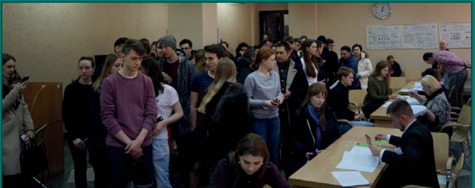
УИК № 158. Общежитие Горного университета. 18.03.2018.