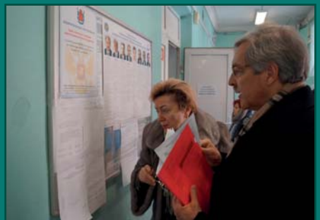
Проверка информационных стендов в УИК № 125 (Василеостровский район). 18.03.2018.